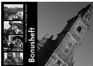
Marketing für die Erlanger Altstadt. Einzelhändler und Gastronomen haben gemeinsam mit dem Projektmanagement ein Bonusheft für Studenten und Neubürger entwickelt.

lich und privaten Akteure in ihren Interessen repräsentiert sehen. Durch den Praxistest soll geklärt werden, wie bei verschiedenen Aufgabenstellungen effektive und effiziente Arbeitsstrukturen aufgebaut und dauerhaft installiert werden können.